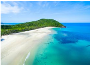
Cape Tribulation 📍