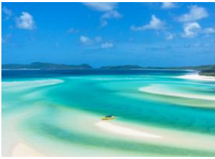
Whitsundays Islands 📍