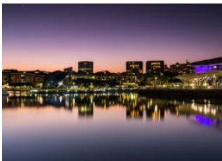
Darwin Airport (DRW) 📍 🚗 12km - ⌚ 15m Darwin 📍