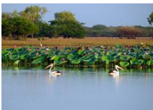
Darwin 📍 🚗 300km - ⌚ 3h Parc National de Kakadu 📍