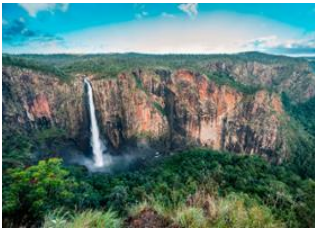
Mission Beach 📍