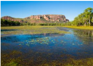
Parc National de Kakadu 📍 🚗 280km - ⌚ 3h Parc National de Nitmiluk 📍