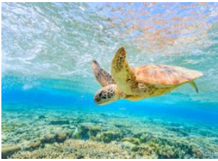
Mission Beach 📍