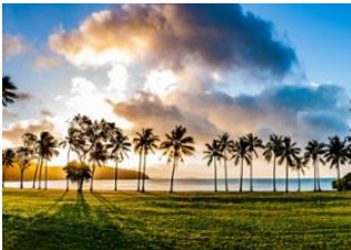
Whitsundays Islands 📍