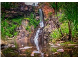
Parc National de Nitmiluk 📍 🚗 290km - ⌚ 3h Parc National de Litchfield 📍