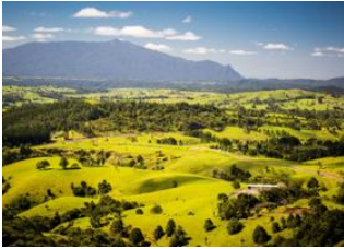
Cape Tribulation 📍 🚗 175km - ⌚ 3h Atherton Tablelands 📍