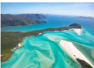
Airlie Beach 📍