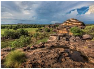
Parc National de Kakadu 📍