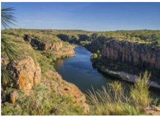
Parc National de Nitmiluk 📍