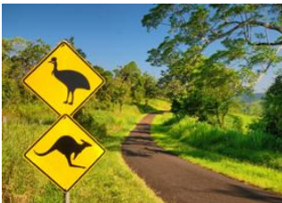
Atherton Tablelands 📍 🚗 150km - ⌚ 2h Mission Beach 📍