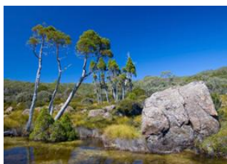
Strahan 🚗 260km - ⌚ 4h Parc National Mount Field