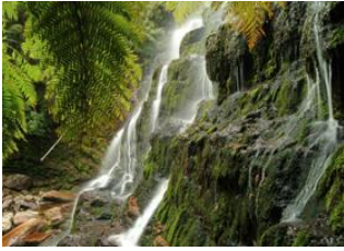
Parc National Mount Field 📍 🚗 70km - ⌚ 1h Hobart 📍