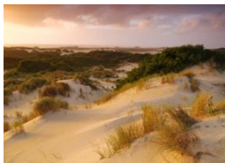
Cradle Mountain 🚗 200km - ⌚ 3h Strahan