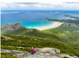
Parc National de Wilson Promontory 📍