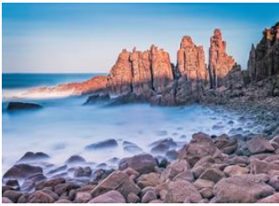
Phillip Island 📍