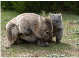
Phillip Island 📍

🚗 160km - ⌚ 2h 45m Parc National de Wilson Promontory 📍