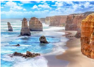
Great Ocean Road 📍