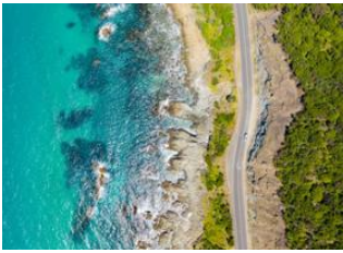
Great Ocean Road 📍