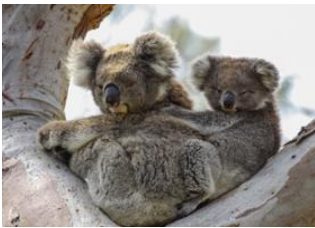
Great Ocean Road 📍