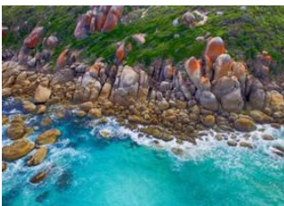
Parc National de Wilson Promontory 📍